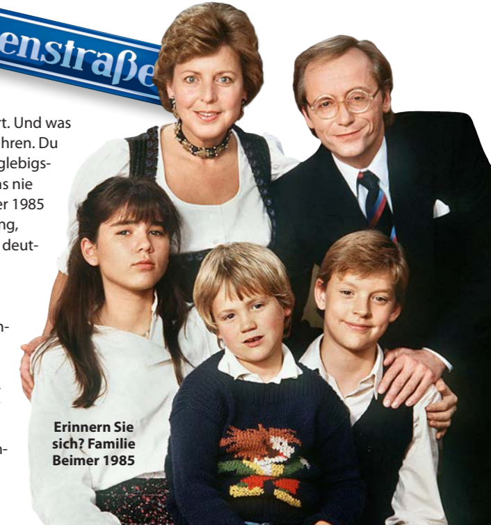
Erinnern Sie sich? Familie Beimer 1985