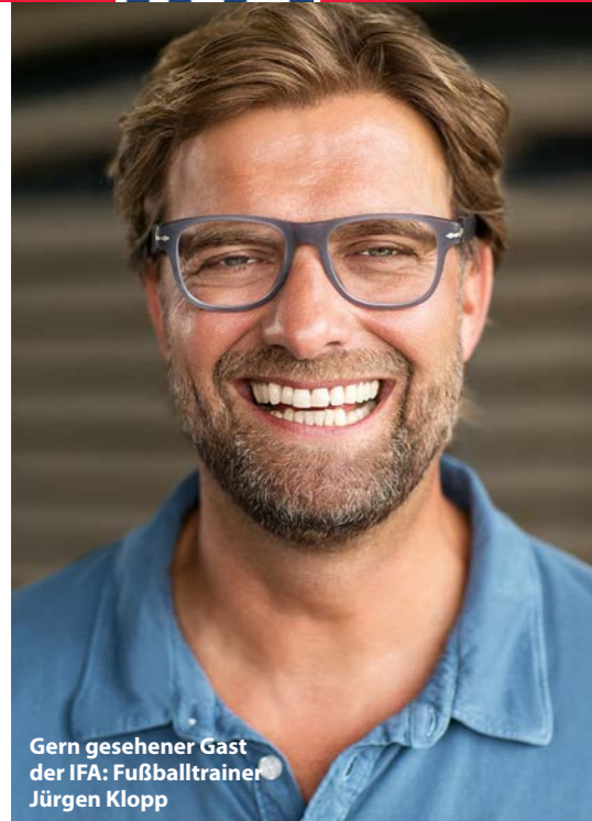
Gern gesehener Gast der IFA: Fußballtrainer Jürgen Klopp