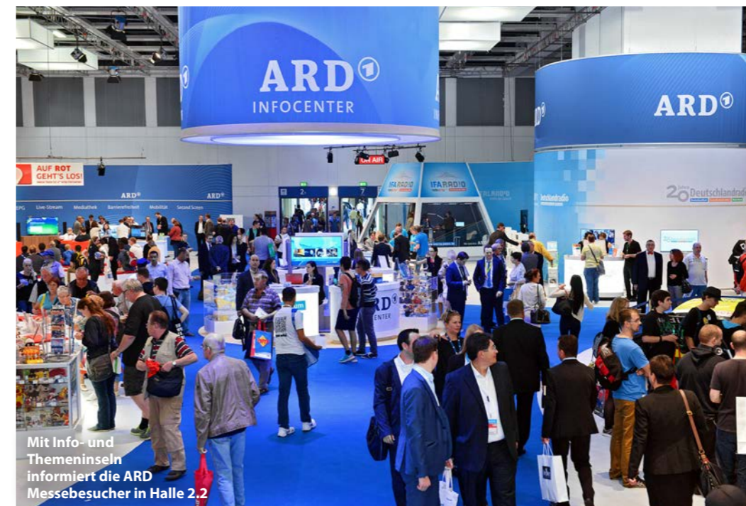
Mit Info- und Themeninseln informiert die ARD Messebesucher in Halle 2.2

Radio und Fernsehen live erleben, Stars zum Anfassen und neue technische Entwicklungen: Das bietet die ARD auf der IFA 2015