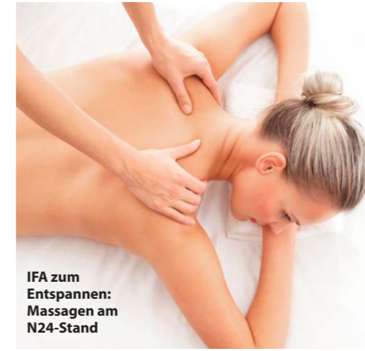
IFA zum Entspannen: Massagen am N24-Stand

www.ifa-berlin.de/events -> das vollständige und tagesaktuelle Programm