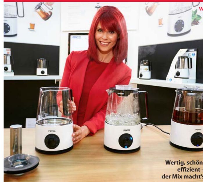
Wertig, schön, effizient – der Mix macht's