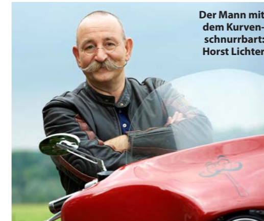
Der Mann mit dem Kurvenschnurrbart: Horst Lichter